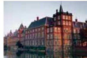
AP ■ KYIV

Moscow's invasion of Ukraine has been widely condemned as an illegal act of aggression. Russian forces have been accused of killing civilians in the Kyiv suburb of Bucha and of repeated attacks on civilian infrastructure including hospitals and a theater in the besieged city of Mariupol that was being used as a shelter by hundreds of civilians. An investigation by The Associated Press found evidence that the March 16 bombing killed close to 600 people inside and outside the building.