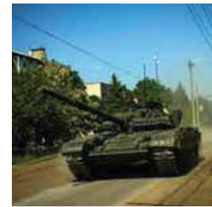
■ KYIV