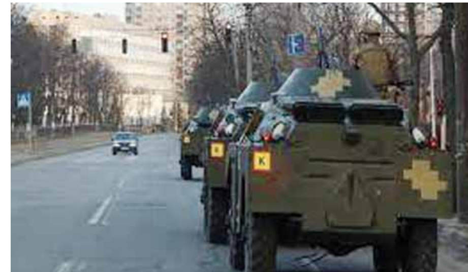
AP ■ KYIV

The mayor of Sievierodonetsk says Russian forces have taken around half of the city in eastern Ukraine.